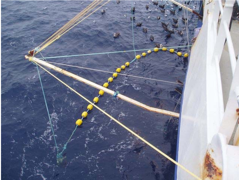
Figure 1 : Exemple d'un "rideau de Brickle". (La photo provient du navire de pêche Janas )