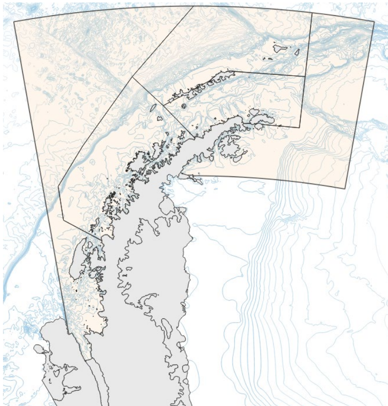
Figure 2 : Sous-zone 48.1 avec cinq unités de gestion candidates proposées au paragraphe 4.21.